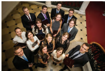
Die stolzen AbsolventInnen freuen sich über den erfolgreichen Abschluss