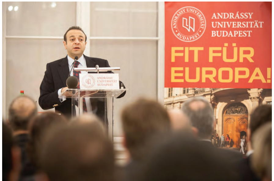
Egemen Bağış, Europaminister der Türkei an der AUB

Im Rahmen einer gemeinsam organisierten Veranstaltung der Türkischen Botschaft in Ungarn und der Andrássy Universität Budapest (AUB), sprach am Donnerstagabend, dem 6. Dezember 2012 Egemen Bağış, erster Europaminister der Republik Türkei und Hauptverhandlungsführer im Rahmen der türkischen Beitrittsverhandlungen mit der Europäischen Union seit 2011 vor zahlreichen Gästen im Spiegelsaal der AUB. Neben dem Botschafter der Republik Türkei in Ungarn, Hasan Kemal Gür waren weitere BotschafterInnen und VertreterInnen der Botschaften von Algerien, Ägypten, Belgien, Bulgarien, Frankreich, Griechenland, Israel, Korea, Mazedonien, Moldawien, Österreich, Pakistan, Palästina, Polen, Rumänien, Serbien, Slowenien und Zypern anwesend. Der Rektor der AUB, Prof. Dr. András Masát, welcher sich erfreut zeigte, vor einem so hoch besetzten Publikum an der AUB zu sprechen, begrüßte Bağış und die Gäste mit kurzen Worten über die AUB und erwähnte die Brisanz, welche das Thema des Vortrages von Bağış in sich hatte. Nach der Rede von Masát gab Botschafter Gür eine kurze Einführung zum englischsprachigen Vortrag mit dem Thema "Changing Dynamics of Turkey-EU Relations: New Opportunities and Challenges" von Bağış. Der türkische Minister ging folgend, ausgehend vom Motto der AUB „Fit für Europa“, welches er auch zu seinem Motto erklärte, auf