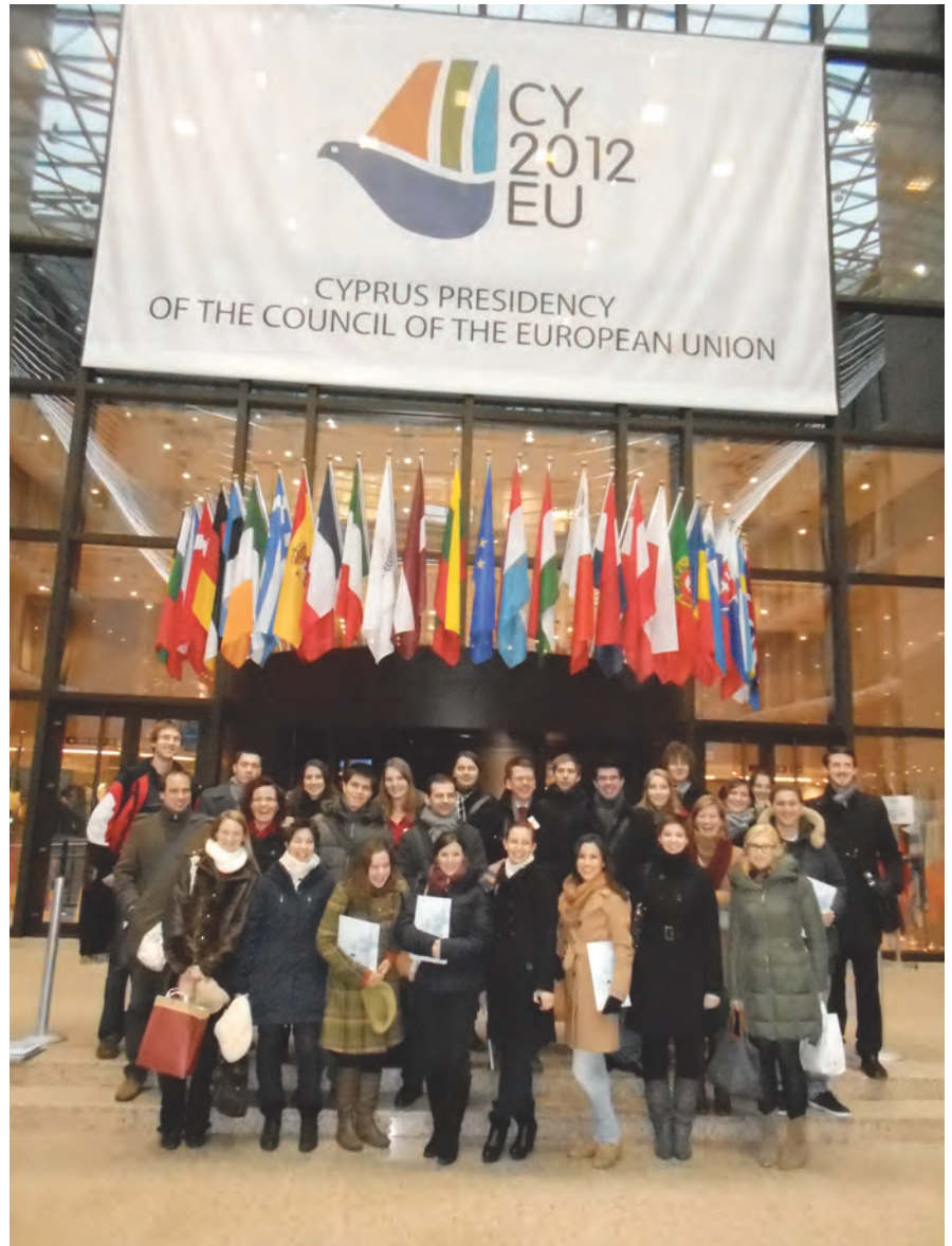
Die Studierenden in Brüssel bei der Europäischen Kommission

Am nächsten Tag hat die Gruppe den Vormittag und auch das Mittagessen in der NATO verbracht, wo die Studierenden sich mit Vertretern der ungarischen und deutschen Delegation unterhalten konnten. Am Abend fand ein gemeinsames Abendessen statt, bei