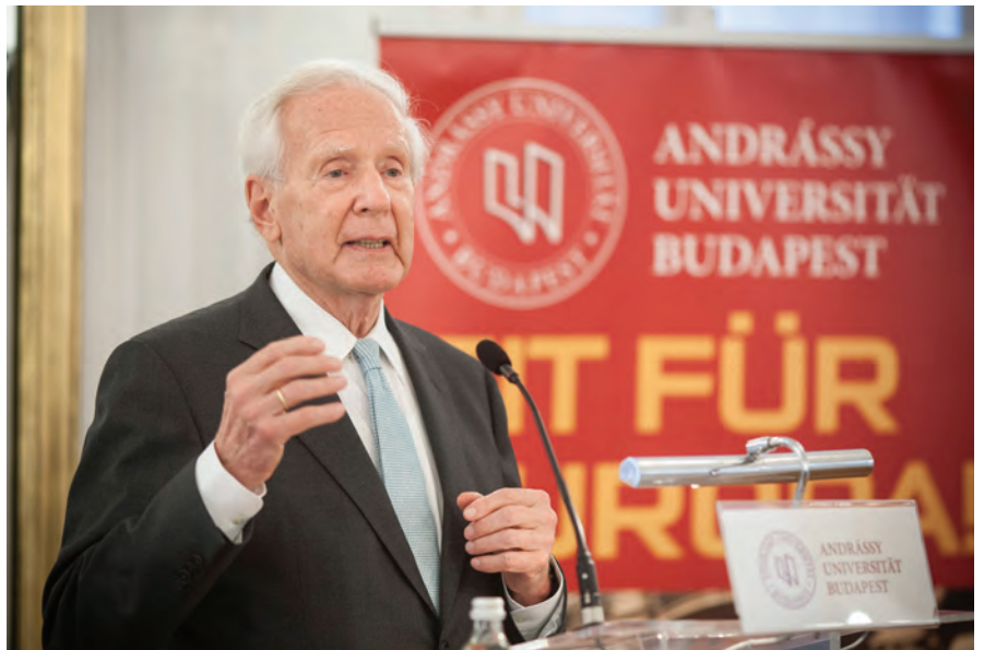
Klaus von Dohnanyi, Bundesminister a.D. über die deutsch-ungarischen Beziehungen