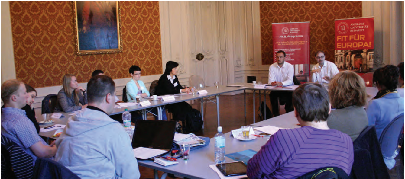
Internationaler Doktorandenworkshop im Andrássy-Saal zum EU-Skeptizismus