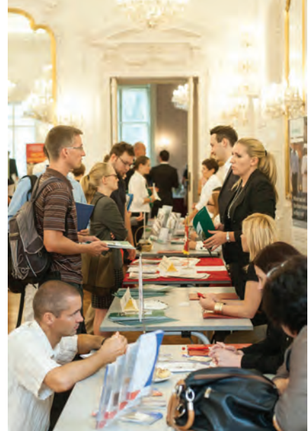
Zahlreiche Studierende informieren sich bei den Ausstellern auf der Karrieremesse

Am Nachmittag fanden die netzwerkbildenden Programme der drei Fakultäten, der Doktorschule und des Donau-Institutes statt. Es wurden unter anderem die verschiedenen Studiengänge vorgestellt, Masterarbeiten, Dissertationsprojekte und Forschungsarbeiten präsentiert und Diskussionen zu verschiedenen Themenbereichen geführt. Die Fakultäten luden Alumni ein, um über ihre Erfahrungen im Studium, ihren Berufseinstieg und ihre derzeitige Arbeitsstelle zu berichten. Bei dieser Gelegenheit konnte das Netzwerk der Fakultäten intern und mit externen Interessierten verstärkt werden. Zum Abend desselben Tages lud der Rektor der AUB, Herr Prof. Dr.