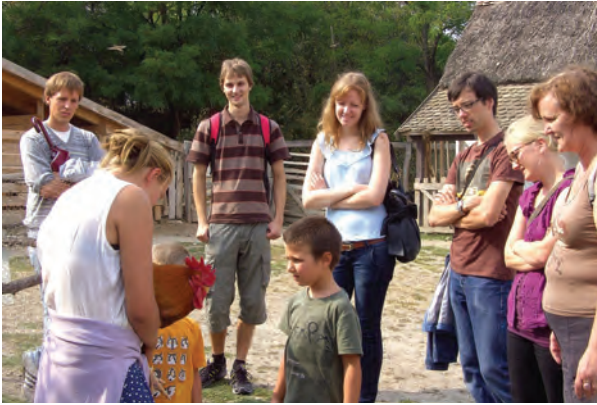
„Storchenlager“ für die AUB-Erstsemesterler in Skanzon, 01.09.2012