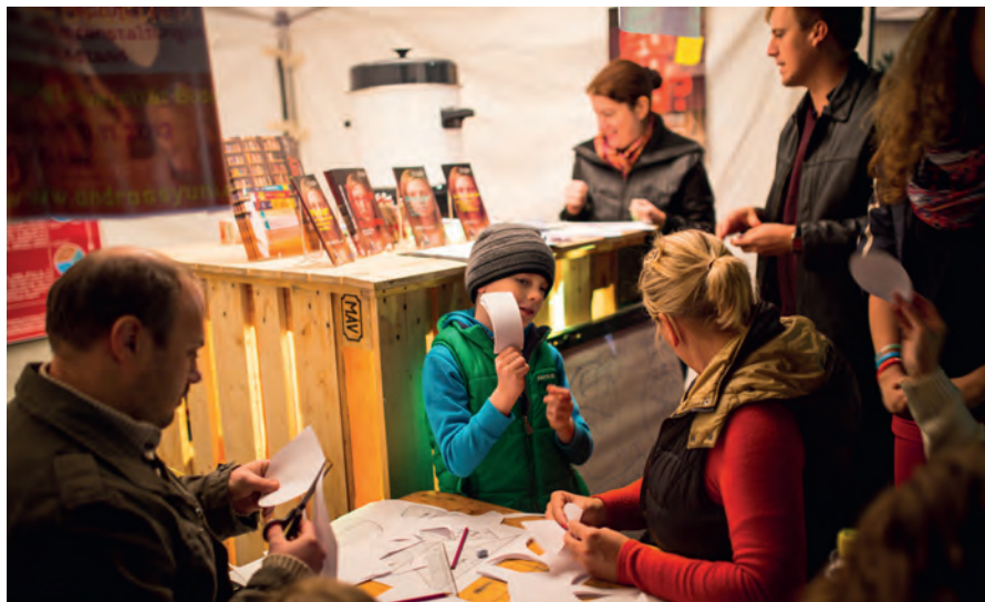
Alt und Jung am Stand der AUB bei der Nacht der Forschung

Bereits am Freitagnachmittag, den 27. September 2013 begann die landesweite Nacht der Forschung an zahlreichen Orten in Budapest. Auf dem Gelände rund um das Veranstaltungshaus Dürer präsentierte im Rahmen des