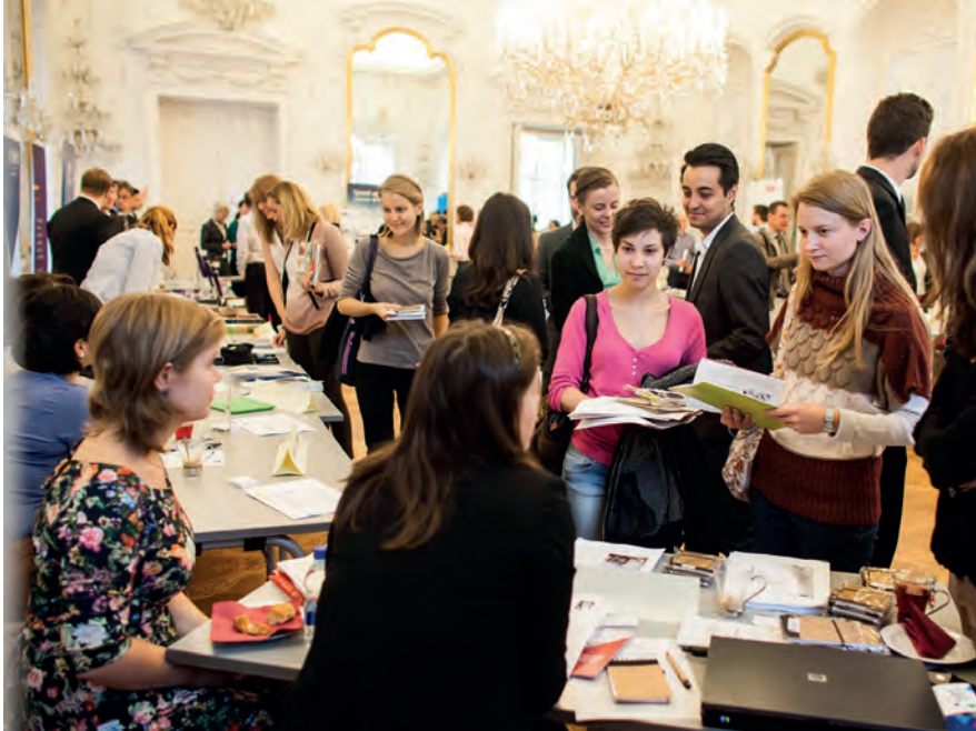
Zahlreiche Studierende nahmen die Gelegenheit wahr und informierten sich über ihre Karrieremöglichkeiten bei den Ausstellern auf der Karrieremesse

Zum diesjährigen Andrássy-Netzwerktag konnten noch mehr Unternehmen und Institutionen an der AUB zur Karrieremesse begrüßt werden als in den vorangegangenen Jahren.