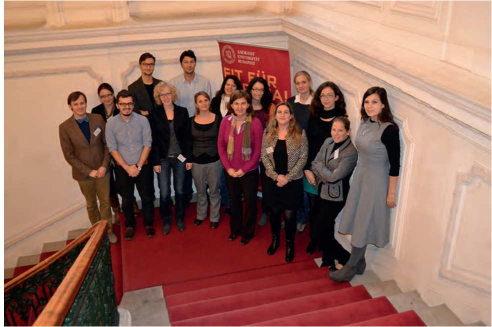
Gruppenbild der TagungsteilnehmerInnen

te Braunschweig) nachgemachten Gesellschaftsspielen in der DDR. Wegen der geringen Produktionszahlen, teuren Anschaffungskosten und auch aufgrund von Verboten wurden Gesellschaftsspiele von der Bevölkerung kopiert oder neue Spiele erfunden. Der große Fundus an Gesellschaftsspielen, die er bislang zusammengetragen hat, bildet nicht nur eine anschauliche Materialsammlung, sondern ist auch ein eindrückliches Abbild der Lebensreali-