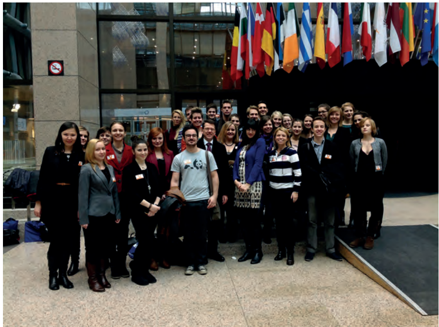
Gruppenbild beim Rat der EU im Justus-Lipsius-Gebäude