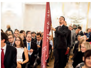
Feierliche Eröffnung des 12. Studienjahres an der AUB – S. 13