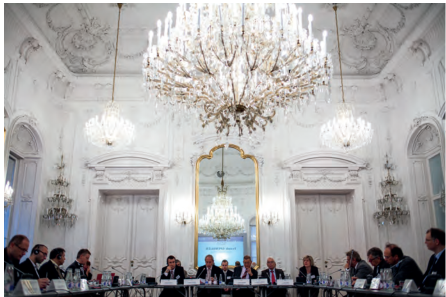
Expertinnen und Experten trafen sich zum Plenum im Spiegelsaal der AUB, um über Fragen der Nachhaltigkeit in Europa zu diskutieren