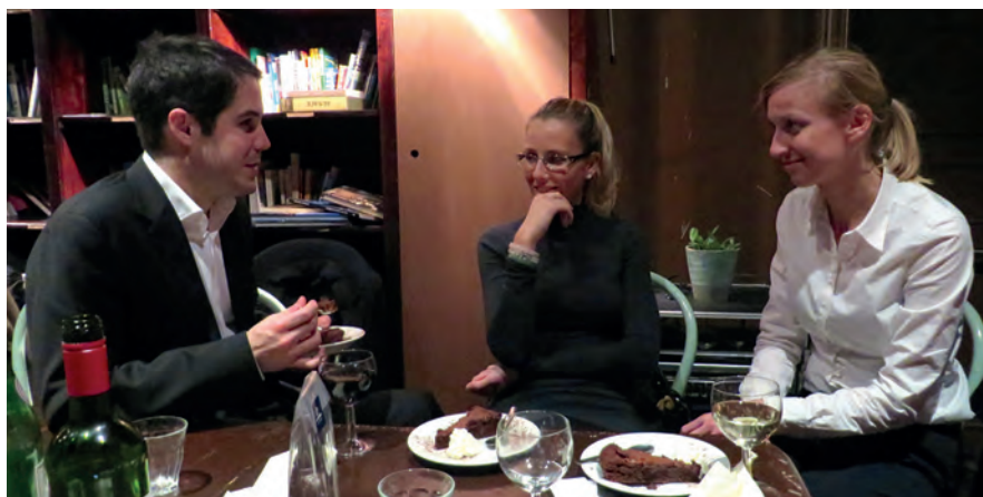
„AUB-Alumni“ im Austausch in gemütlicher Runde in Brüssel – ehemalige Studierende und MitarbeiterInnen

Im Rahmen der jährlichen Brüssel-Exkursion der Studierenden der AUB (siehe auch Bericht auf Seite 34) lud die Fakultät VSR die in Brüssel lebenden Alumni und ehemalige Mitarbeiter der AUB zu einem gemeinsamen Abendessen mit den Studierenden am 5. Dezember 2013 ein. Es bot sich dabei nicht nur die Gelegenheit, dass die Alumni sich treffen konnten, vielmehr kam es auch zu einem regen Erfahrungsaustausch mit den Studierenden. Gedankt wurde hier auch den Alumni, die bei der Organisation und Gestaltung der Exkursion tatkräftig mitgeholfen hatten.