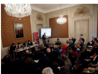
Festliches Symposium und Podiumsdiskussion über Andrássy und Deák – S. 28