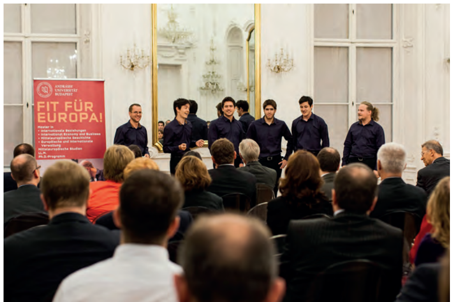
Die Sixtones sorgten a capella für einen gelungenen musikalischen Einstieg in den Netzwerkabend