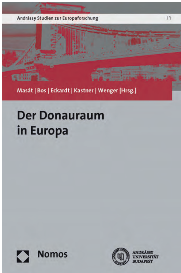
Das Cover des ersten Bandes der Schriftenreihe