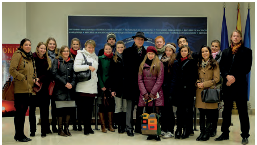
Gruppenbild im mazedonischen Außenministerium in Skopje