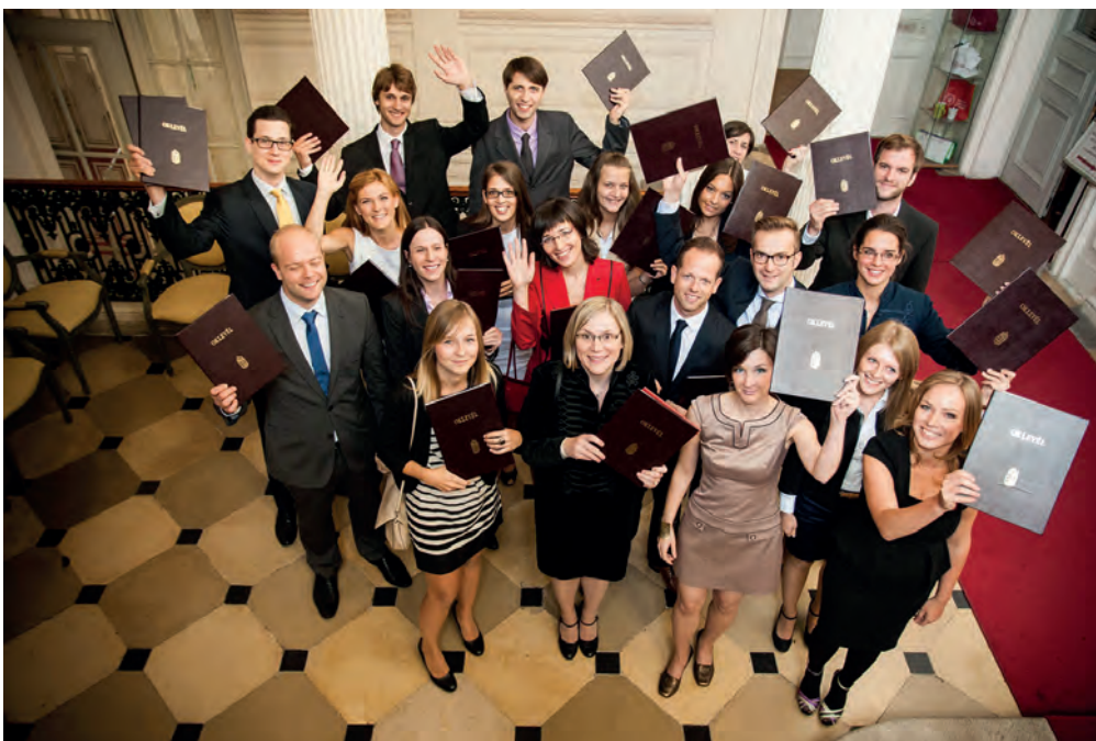
Stolz auf das Erreichte - die neuen Absolventinnen und Absolventen