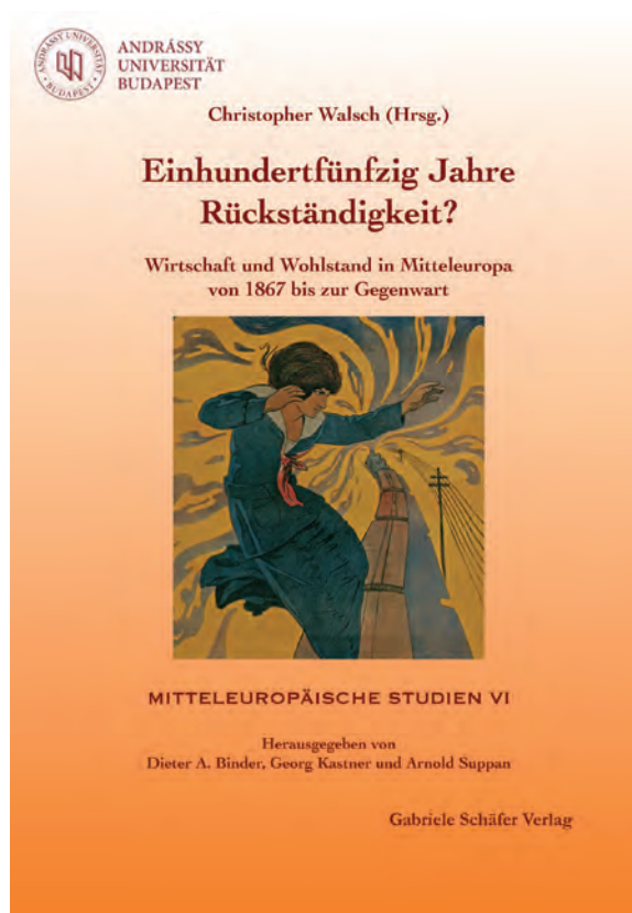
Das Cover des jüngsten Bandes der Schriftenreihe