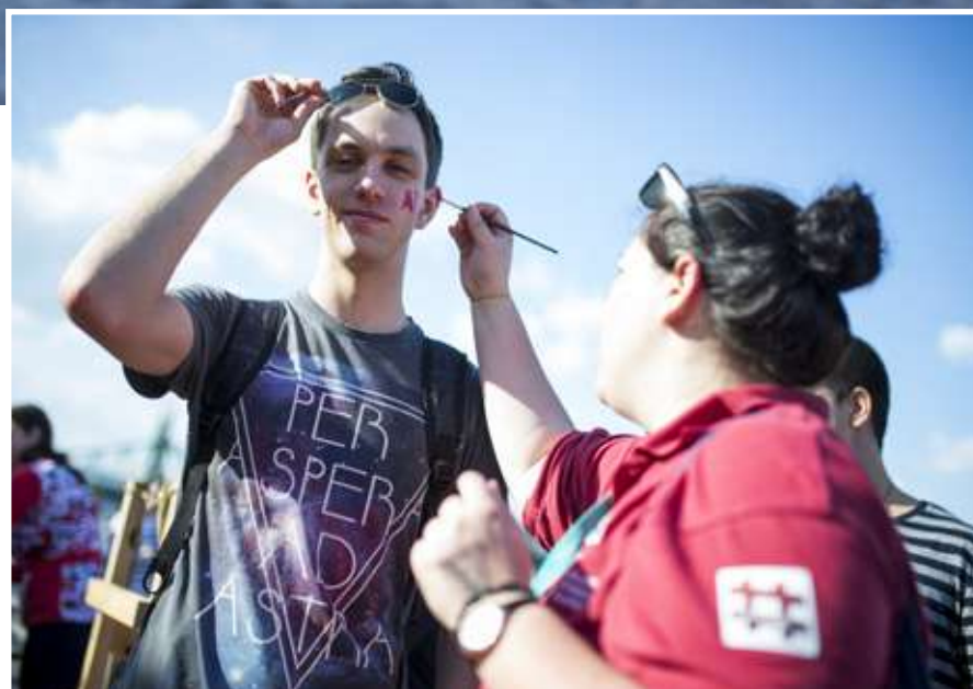
Im Fan-Lager der AUB wurde fleißig geschminkt.