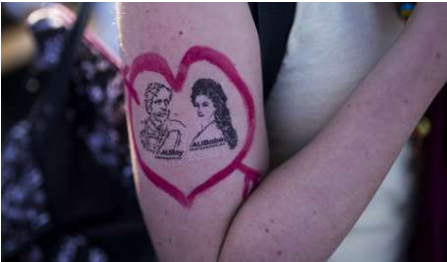
Graf Andrássy und Kaiserin Sissi zierten die AUB-Fans beim Wettkampf.