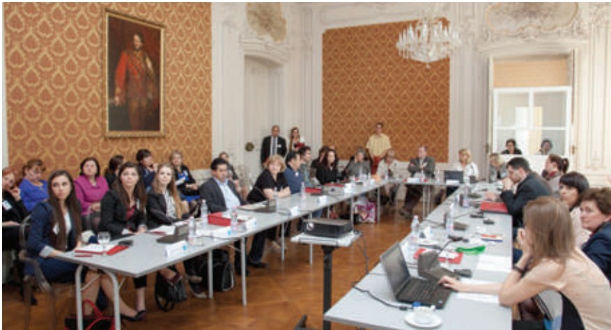
Repräsentanten verschiedener ungarischer Institutionen diskutierten die Bildungspolitik in Bezug auf die Integration der Roma.

Husz v. a. die Praxis jener Eltern, die ihre Kinder entweder nicht in Schulen mit hohem Roma-Anteil anmelden oder sie aus solchen gar wieder herausnehmen würden. Das Motto laute hier „Integration ja, aber nicht in meinem eigenen Hinterhof“, so Husz.