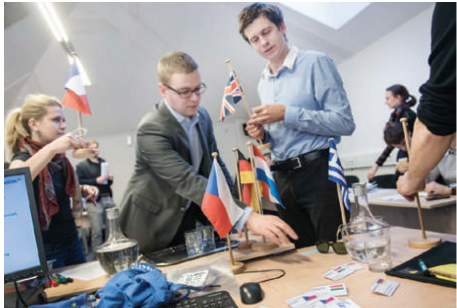
Studierende bereiten sich auf die simulierte Ratssitzung vor.

Zur Vorbereitung hatten die Studierenden die inhaltlichen Interessen des von ihnen vertretenen EU-Landes identifiziert und sich somit in die realen aktuellen Themen der Europäischen Union (z. B. zum Ukraine-Konflikt, zur Wirtschaftskrise oder zum Flüchtlingsdrama im Mittelmeer) eingearbeitet. Die Verhandlungen wurden sehr ernst- und lebhaft geführt und führten zu einer