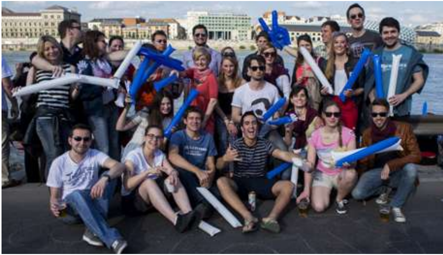
Am Ziel warteten die Fans der Mannschaft auf ihr Team und feierten sie auf den letzten Metern an.

Amateur-Drachenbootmannschaft der Studierenden tritt erstmalig bei Ungarns größtem Uni-Sportereignis an