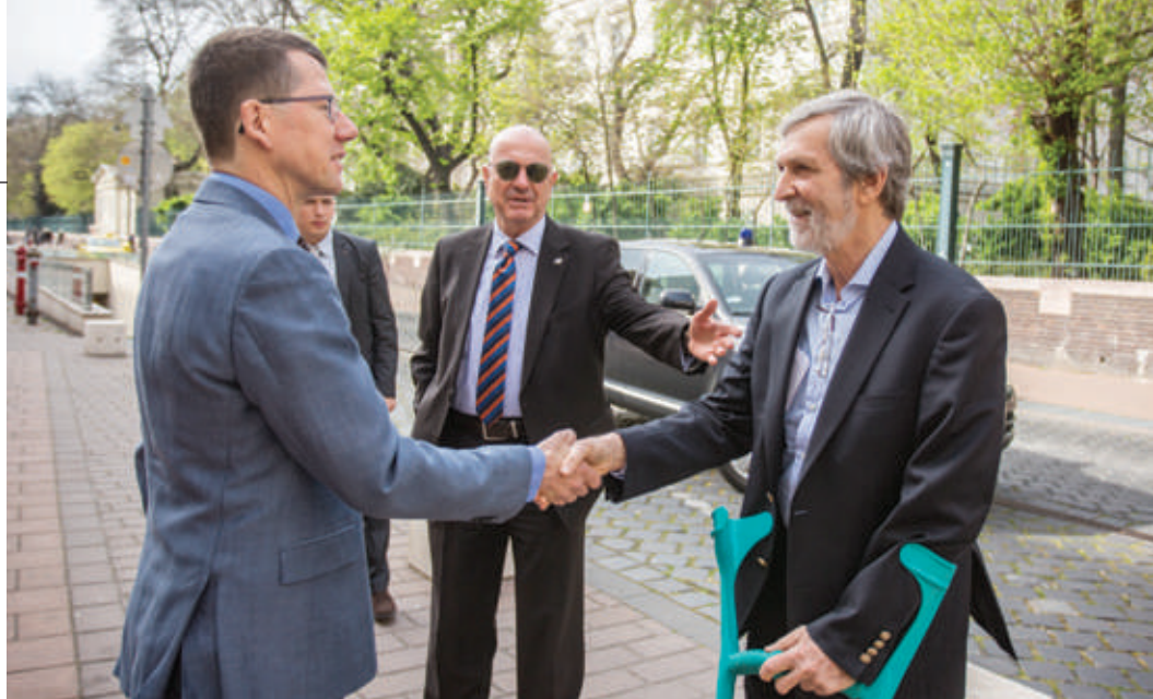
AUB-Prorektor Hendrik Hansen (links) begrüßt Shimon Stein (rechts) in Begleitung des Botschafters des Staates Israel in Ungarn Ilan Mor (Mitte).

Gleichzeitig wies er aber auch auf die Gefahren der derzeitigen Siedlungspolitik Israels hin, die seiner privaten Ansicht nach der Demokratie und dem Ansehen Israels weiter schaden würden und plädierte für neue Lösungsansätze. Gerade dieses Thema sei ein ständiger Streitpunkt in den europäisch-israelischen Beziehungen. Allerdings warnte er davor, die europäische wirtschaftliche Kraft als „Hebel“ nutzen zu wollen, um Israel zu einer bestimmten Politik in Bezug auf