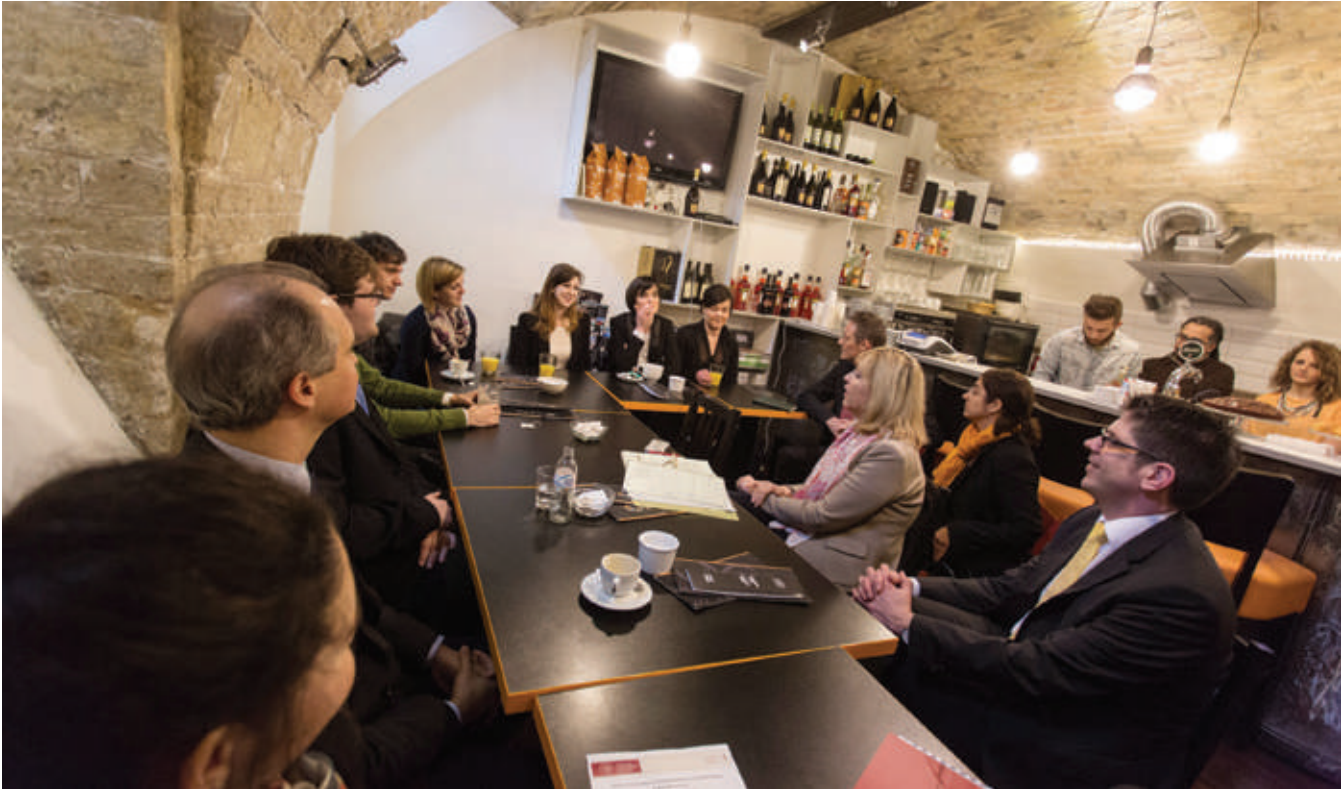
Europaministerin Merk in gemütlicher Runde mit Studierenden und Alumni der AUB.

Europaministerin Dr. Beate Merk besuchte am 23. Februar die AUB und gab ein klares Bekenntnis für die weitere Unterstützung der Universität ab: „Bayern will, dass die AUB ihre außerordentlich erfolgreiche Arbeit fortsetzt und weiter ausbaut. Sie ist ein echtes Aushängeschild für das Zusammenwachsen Europas und eine Ausbildung über die Grenzen hinweg. Wir wollen daher die AUB weiter unterstützen.“ Merk traf