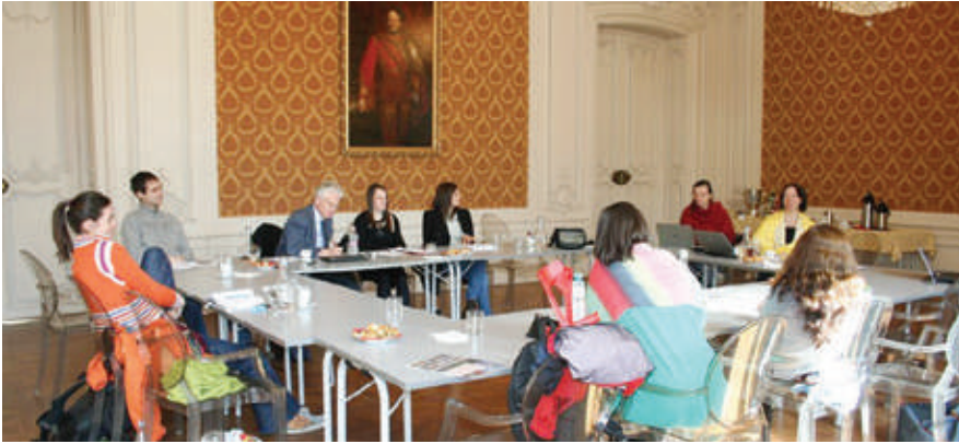
Der Workshop fand in den historischen Räumen des Festetics-Palais statt.

Erster von DoktorandInnen durchgeführter PhD-Methodenworkshop an der AUB zu qualitativen und quantitativen empirischen Methoden