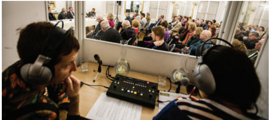
Die Diskussion wurde simultan gedolmetscht, sodass auch nichtungarischsprachige Gäste die Möglichkeit hatten, Fragen an Németh und die anderen Teilnehmer zu richten.

Németh antwortete überaus ausführlich, was das zahlreich erschienene Publikum sichtlich genoss: Hier sprach jemand, der Einblicke in für Außenstehende kaum bekannte Details in die inneren Zirkel der damaligen Macht gab. Er berichtete über die äußerst schwierigen Bedingungen, unter denen im hochverschuldeten