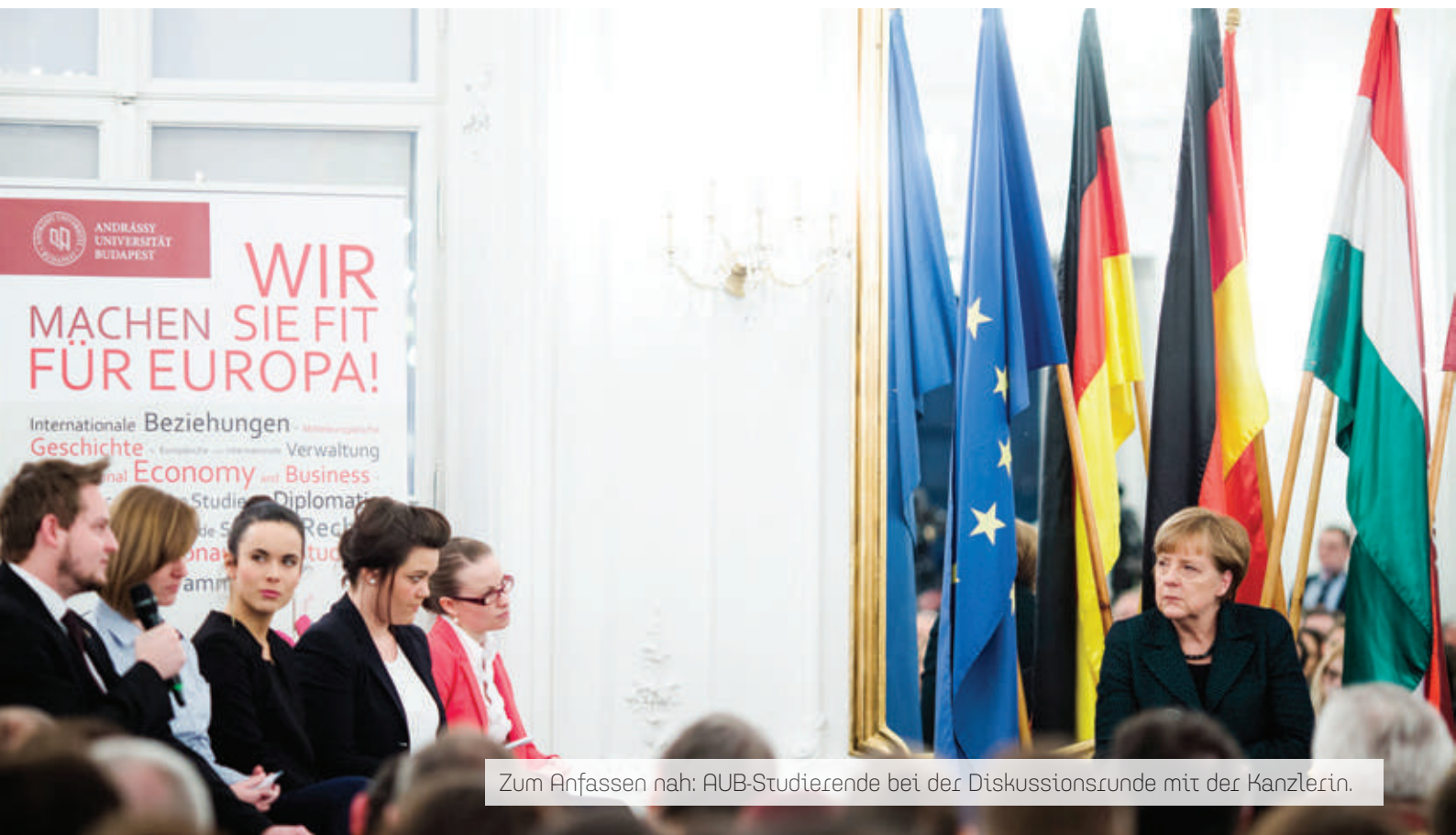
Zum Anfassen nah: AUB-Studierende bei der Diskussionsrunde mit der Kanzlerin.

Auch ich hatte eine Frage zur Karriere in der Politik: Ich wollte von ihr wissen, welche Ratschläge sie als bedeutendste Frau in der Welt der Politik gerade uns Studentinnen geben könnte, um später erfolgreich eine politische Laufbahn einzuschlagen. Ihre Antwort war einfach: „Erstmal etwas Vernünftiges studieren und dazu ein bisschen Praxiserfahrung sammeln“. Und sie unterstrich: „Frauen sind wie Männer: Sie sollten also an sich glauben, den eigenen Weg machen und sich nicht unterkriegen lassen, aber auch nicht beleidigt sein, wenn man mal verliert“. Im Falle einer Niederlage solle man dann als Frau nicht denken, dass der Grund dafür das „Frausein“ sei: „Das passiert Männern auch“, so Merkel.