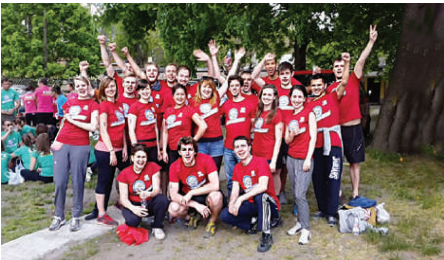
Das AUB-Drachenbootteam 2015.

Im Sommersemester 2015 maß sich unsere kleine Uni nun auch sportlich mit den „Großen“: Zum ersten Mal trat ein AUB-Team zum Amateur-Drachenbootrennen bei der „Dunai Regatta“ (Donau-Regatta), dem größten universitären Sportfestival Ungarns, gegen einige der größten ungarischen Universitäten an.