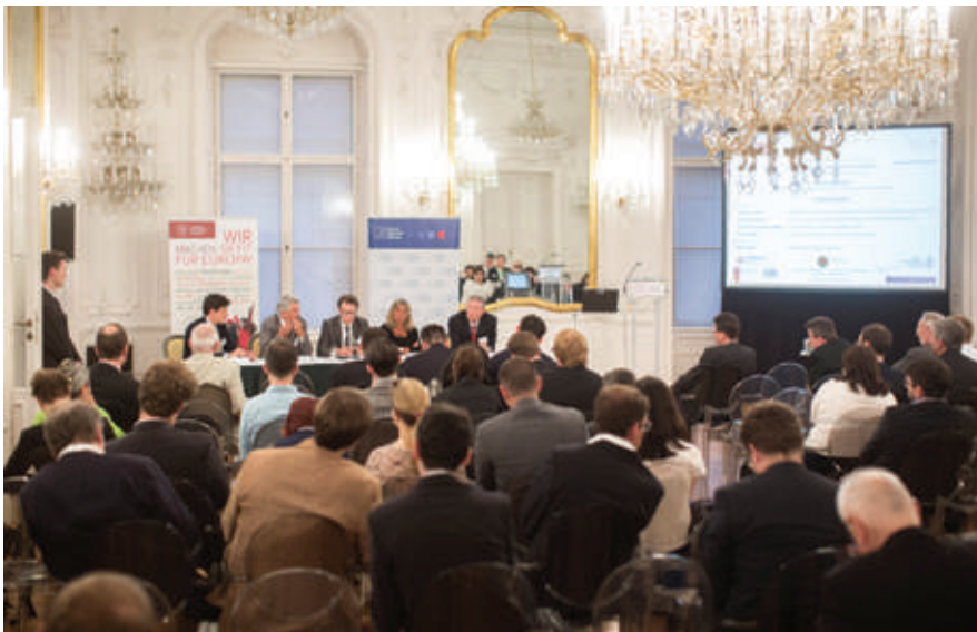
Die Podiumsdiskussion zu „Time for a European Internet?“ im Spiegelsaal der AUB.