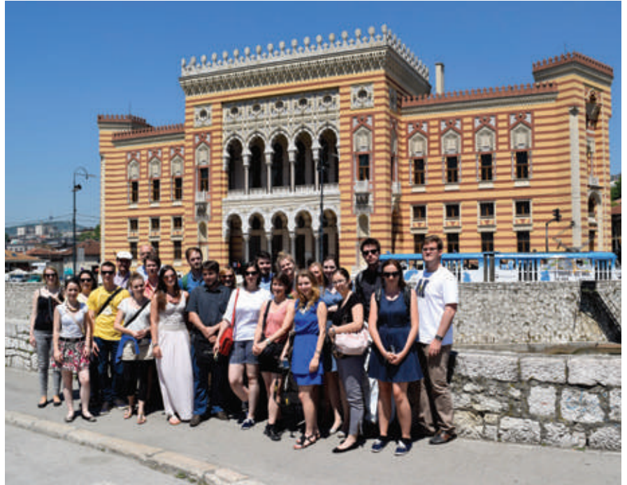
Gruppenfoto vor der Nationalbibliothek in Sarajevo.

Am 4. Juni verließen wir Sarajevo, wo wir in jenem Hotel gewohnt hatten, in dem während der Belagerung der Stadt die letzten verbliebenen Auslandskorrespondenten ihre Unterkunft hatten und welches jetzt nach der Renovierung ein wenig den Charme der jugoslawischen Selbstdarstellung während der Olympischen Winterspiele spiegelt, um nach Mostar in die Herzegowina zu fahren. Eindrucksvoll konnte auf dieser Fahrt wiederum der Versuch, über Sakralbauten die Landschaft „national“ zu besetzen, studiert werden. Fertigteilmoscheen und ebensolche Kirchen, die zumeist jegliche Proportion vermissen lassen, bilden den Auftakt. Das osmanische, muslimische Mostar wird von einem neuen Kirchturm und einem Gipfelkreuz überragt, damit katholisch-kroatisch kontextualisiert und durch