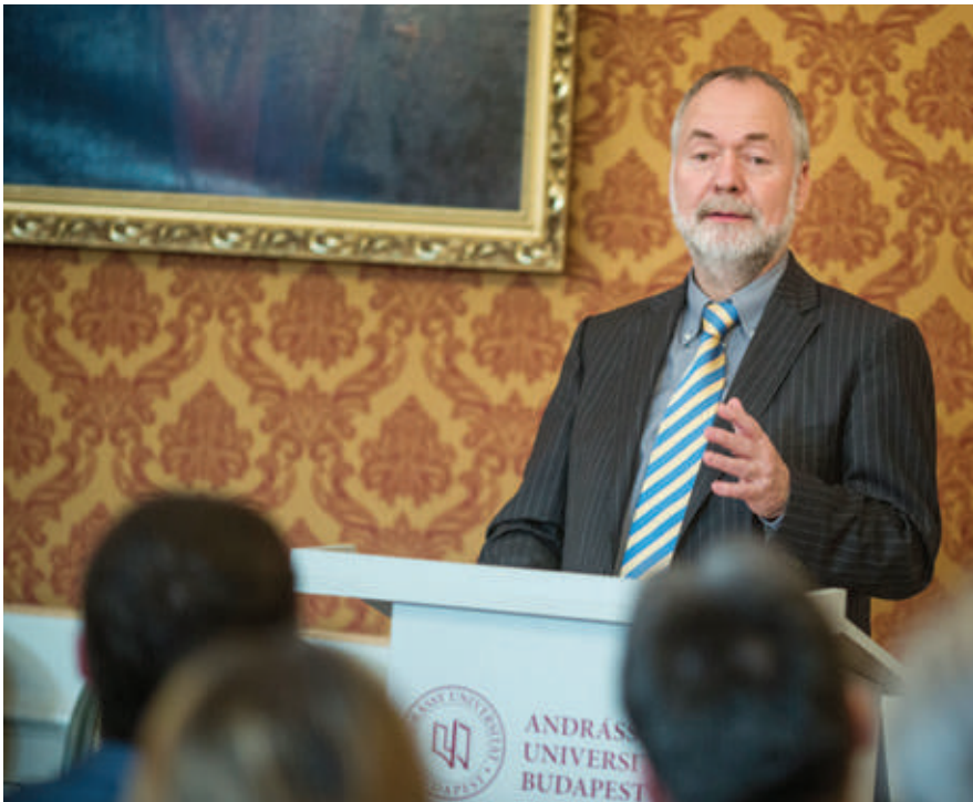
Markus Meckel über die Bedeutung der „Versöhnung über den Gräbern“ und das gemeinsame Erinnern.

Der Präsident des Volksbundes Deutscher Kriegsgräberfürsorge e.V. zur europäischen Erinnerungskultur