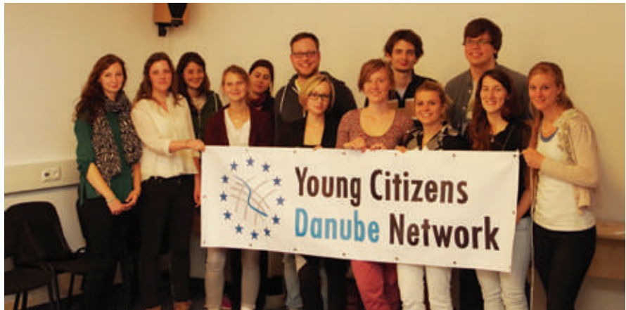
Das YCDN ist ein Netzwerk von jungen Menschen und zivilgesellschaftlichen Akteuren im Donauraum und existiert seit 2010.

Am Nachmittag beschäftigten sich die Teilnehmer tiefergehend mit der sexuellen Ausbeutung. Der aktuelle ungarisch-schweizerische Spielfilm „Viktória“ veranschaulichte die Problematik zusätzlich. Als weiterer Gastredner wurden