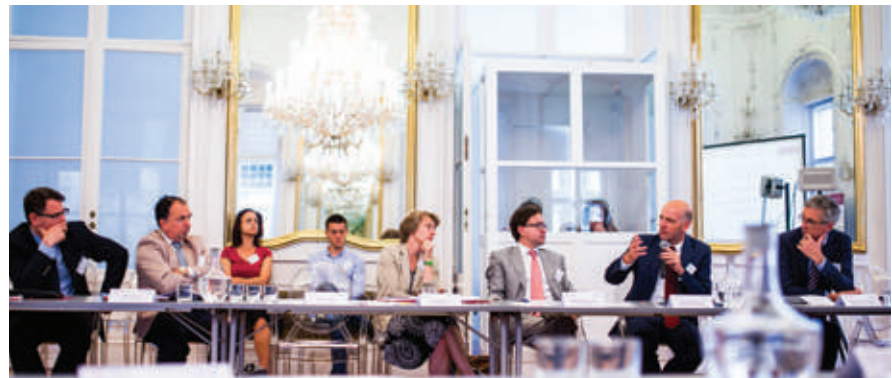
Teilnehmer:innen und Teilnehmer des Workshops im Spiegelsaal der AUB.

Die erste Abteilung richtete zunächst den Blick auf den vom Europarecht ge-