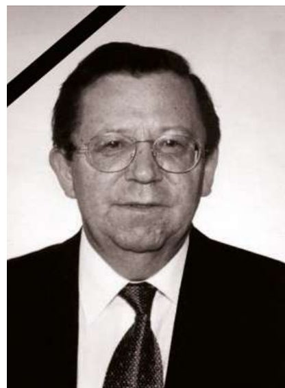
sowie Träger des Verdienstkreuzes der Republik Ungarn.

Horst Haselsteiner war u.a. Ehrenmitglied im Ausland der Ungarischen Akademie der Wissenschaften, und Träger des Ferenc-Deák Staatspreises für Geisteswissenschaften der Stiftung Pro Hungaria Budapest