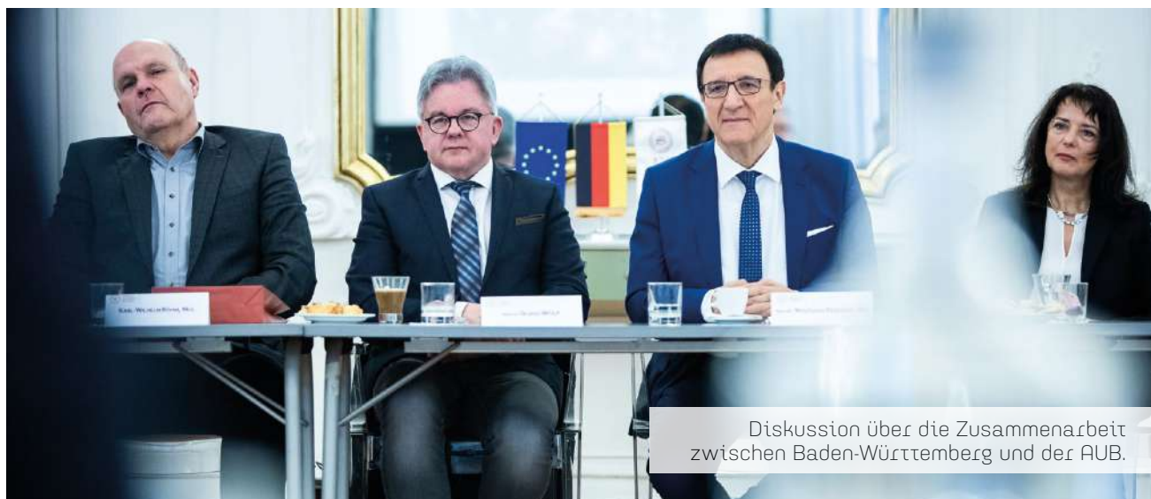
Diskussion über die Zusammenarbeit zwischen Baden-Württemberg und der AUB.

A m 28. März 2019 besuchten Mitglieder des baden-württembergischen Landtags und deren Begleitung die Universität. Zuerst fand ein Gespräch im kleineren Kreis mit dem Rektoratskollegium und VertreterInnen des wissenschaftlichen Personals statt, bei dem die Zusammenarbeit