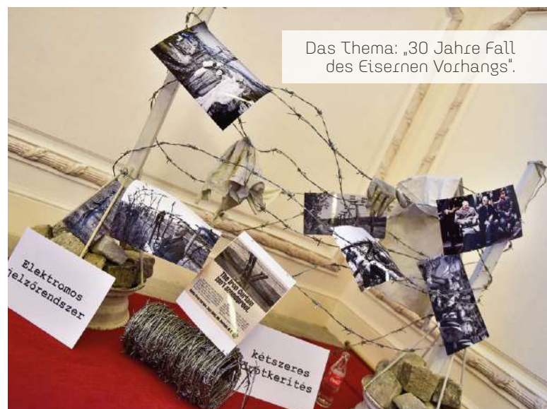
Das Thema: „30 Jahre Fall des Eisernen Vorhangs“.