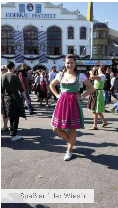
Spaß auf der Wies'n!

M ein Auslandsabenteuer fing im September 2018 in Bayerns Hauptstadt München an. Kurz vor dem Abschluss meines Masterstudiums an der AUB kam ich auf die Idee, ein 5-monatiges Praktikum im deutschsprachigen Ausland zu absolvieren, um mit Auslandserfahrung und Erasmuserlebnissen reicher zu werden.