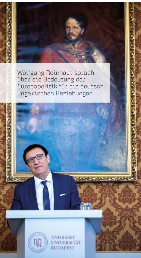
Wolfgang Reinhart sprach über die Bedeutung der Europapolitik für die deutsch-ungarischen Beziehungen.