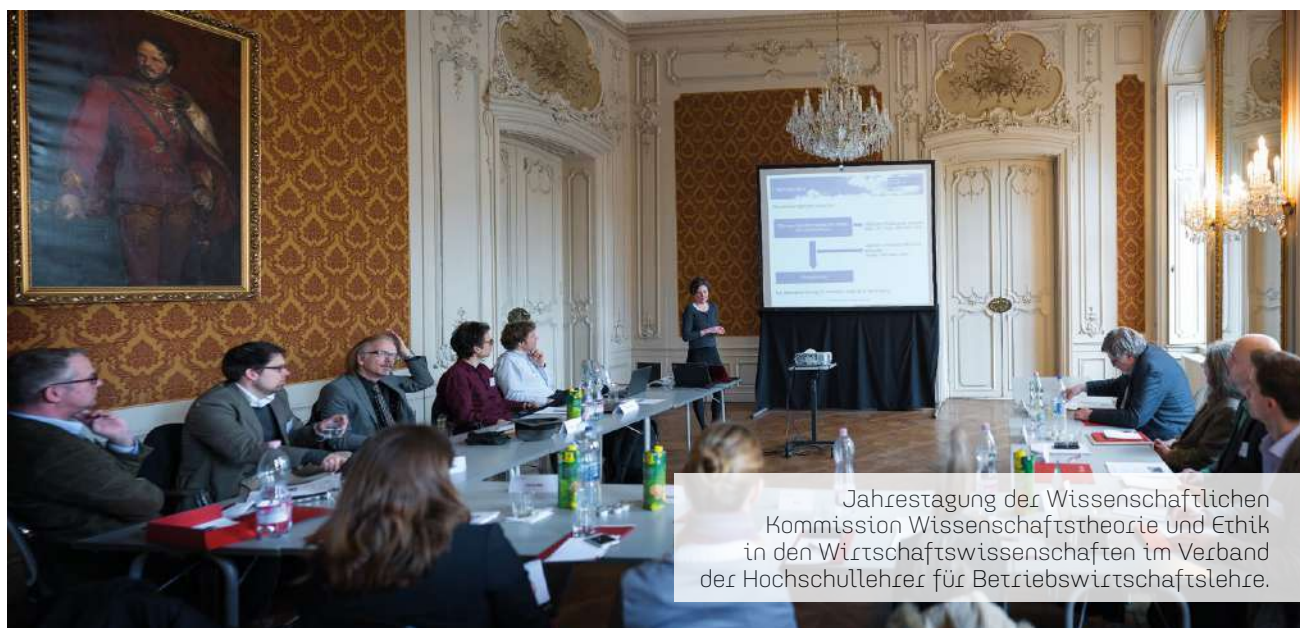
Jahrestagung der Wissenschaftlichen Kommission Wissenschaftstheorie und Ethik in den Wirtschaftswissenschaften im Verband der Hochschullehrer für Betriebswirtschaftslehre.