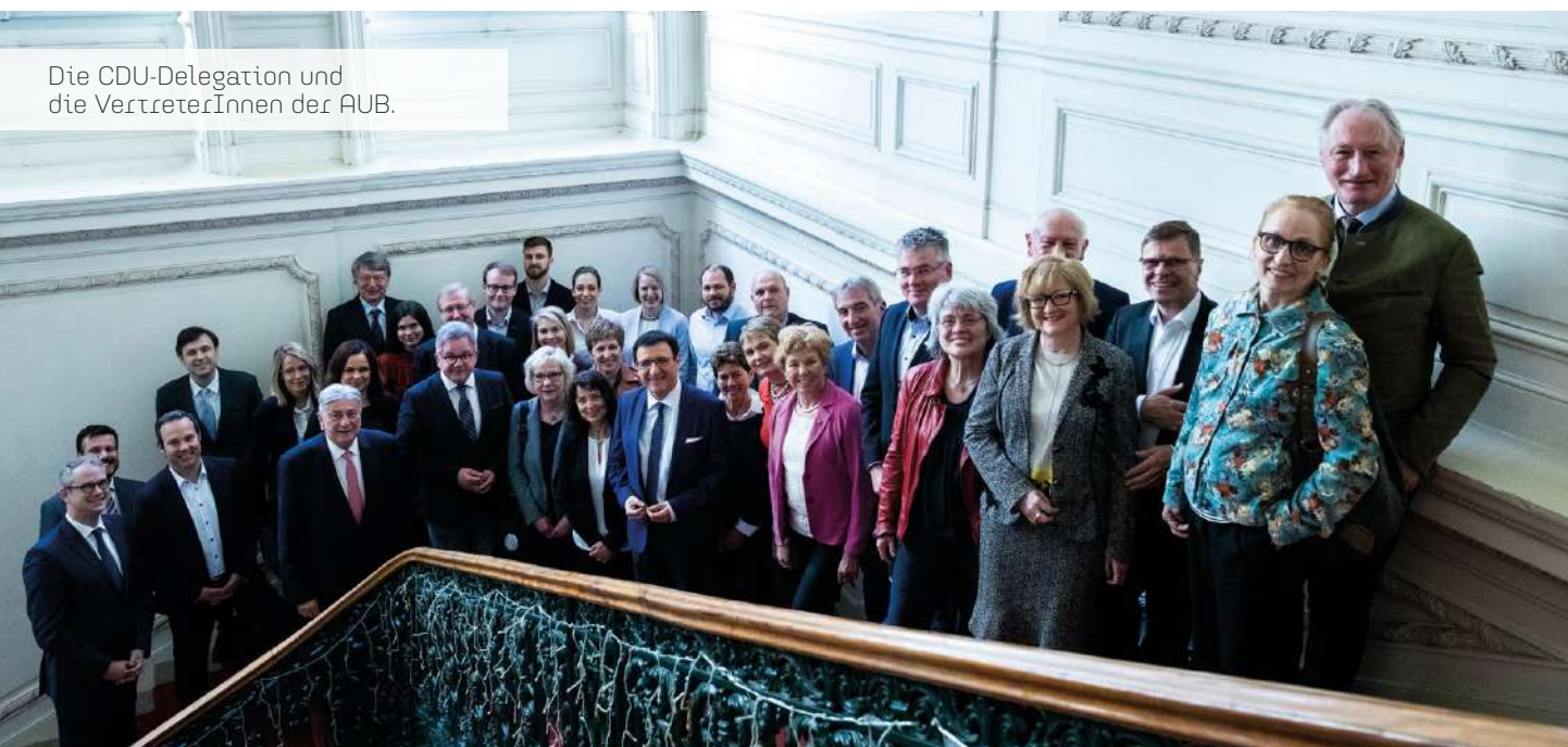
Die CDU-Delegation und die VertreterInnen der AUB.