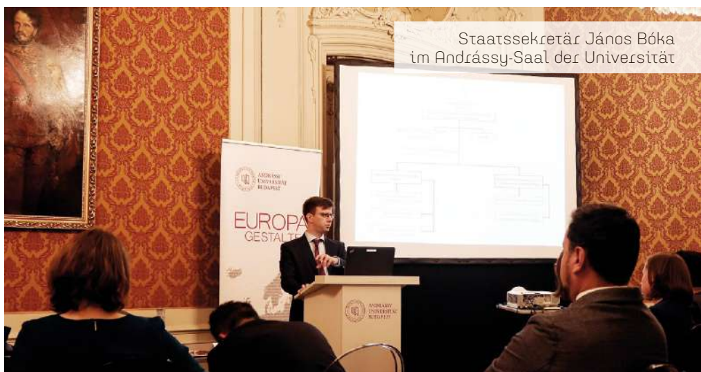
Staatssekretär János Bóka im Andrássy-Saal der Universität

Der anderthalbstündige Vortrag zeigte, dass die Koordinierung der zahlreichen Aufgabenbereiche des Staatssekretariats mit viel Arbeit verbunden ist. Die Anwesenden erhielten darüber hinaus einen Einblick in das alltägliche Leben am Justizministerium und erlangten wichtige Informationen aus erster Hand, die für sie später bei weiteren Lehrveranstaltungen von Nutzen sein können.