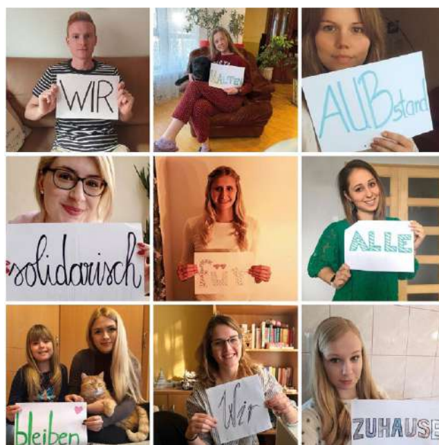
Die Studierenden der AUB

Wir bedanken uns bei allen, die an der Kampagne teilgenommen haben.