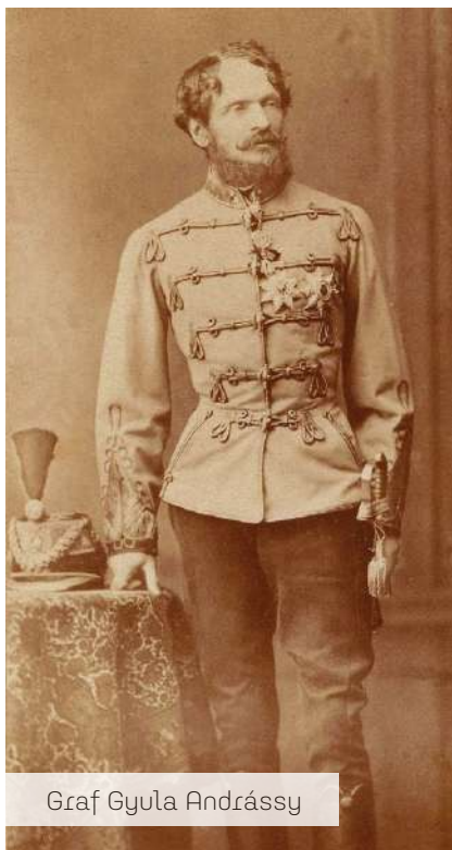
Graf Gyula Andrássy