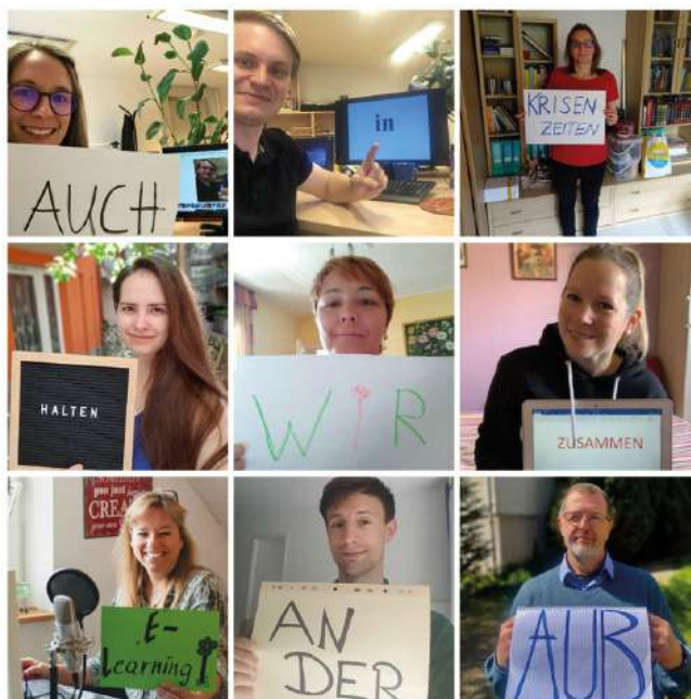
Die Fotocollage des wissenschaftlichen Personals