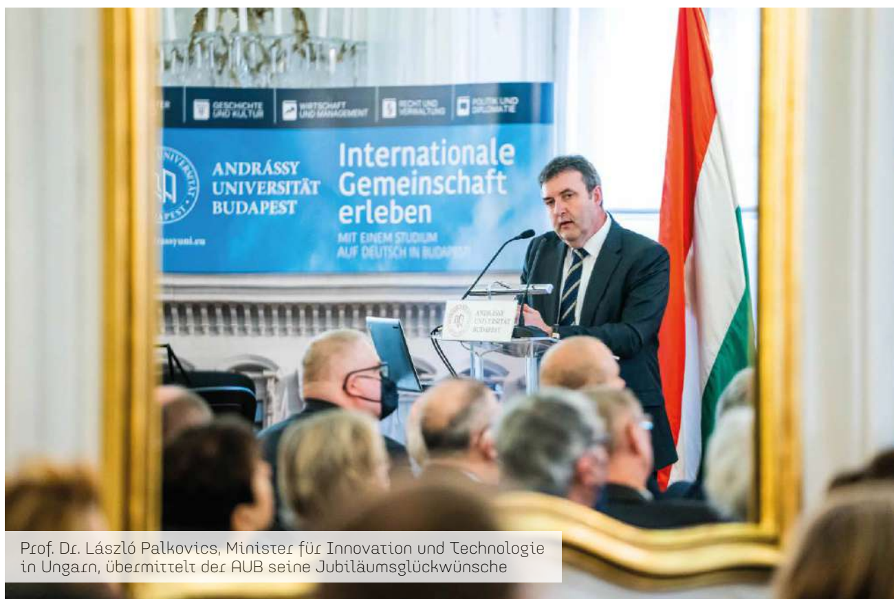
Prof. Dr. László Palkovics, Minister für Innovation und Technologie in Ungarn, übermittelt der AUB seine Jubiläumsglückwünsche

Die Andrássy Universität sei ein akademischer Raum inmitten von Europa, in dem friedlich zusammengearbeitet werden könne. Eine deutschsprachige universitäre Brücke in den Donauroaum, welche für die Stärkung der europäischen Integration stehe. Die Universität werde getragen von ihren Partnerländern und sei Teil der sie umgebenden Gemeinschaft, für die sie sich auch einsetze. In diesem Zusammenhang wies der Rektor auf zwei Projekte der politischen Bildung der AUB hin ( Vokskabin und Vitatkozz velem ), welche junge Leute dazu motivieren sollen, sich mit Politik auseinanderzusetzen. Er betonte, dass Europa auch künftig gut ausgebildete Men-