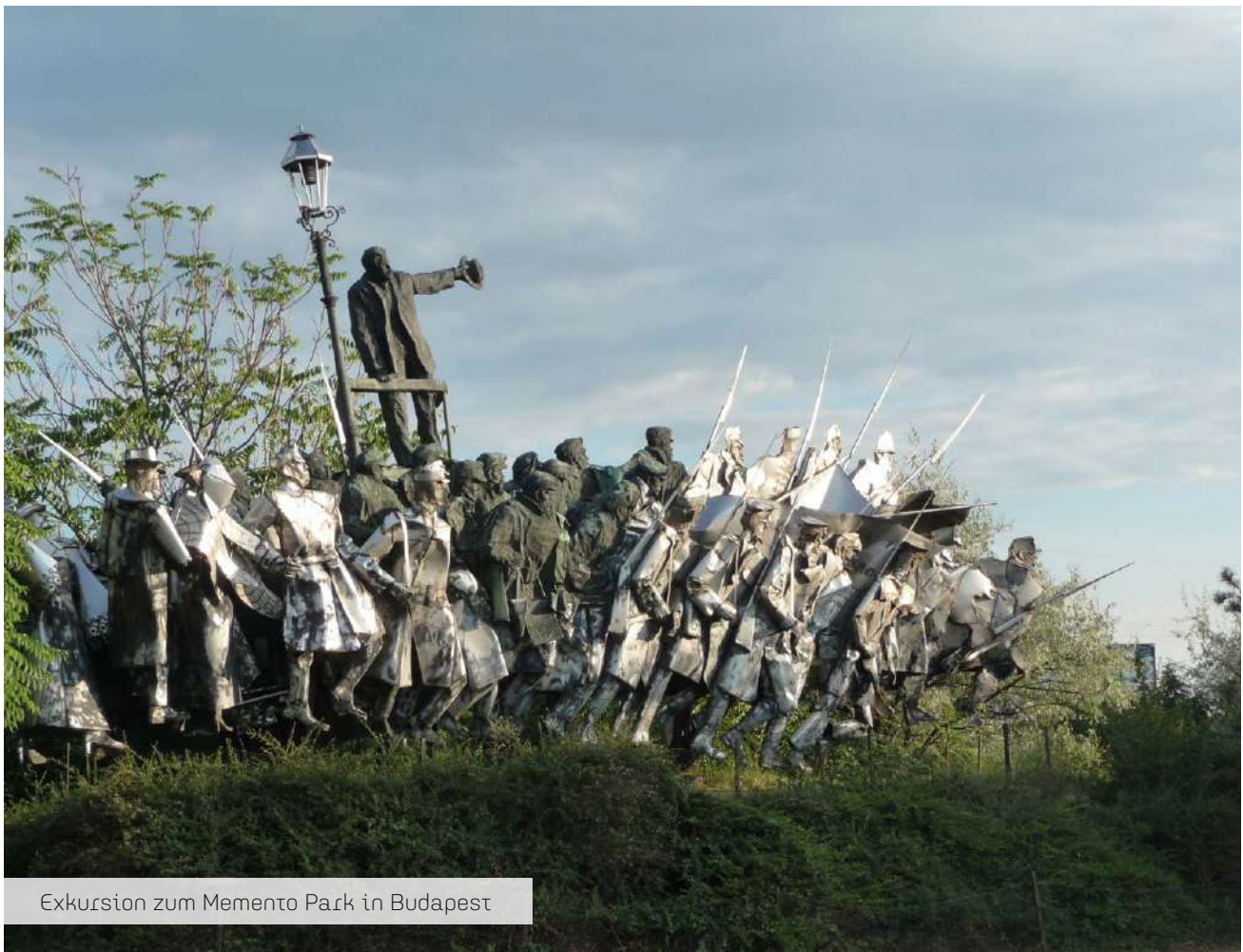
Exkursion zum Memento Park in Budapest