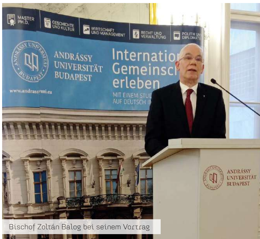
Bischof Zoltán Balog bei seinem Vortrag

Am 21. April waren mit Volker Kauder und Bischof Zoltán Balog gleich zwei prominente Referenten in der Reihe „Religion und Diplomatie“ an der AUB zu Gast. Das Thema war die Bedeutung der Religionsfreiheit und der weltweite Einsatz für Christen in Not – für die sich beide seit vielen Jahren persönlich einsetzen.