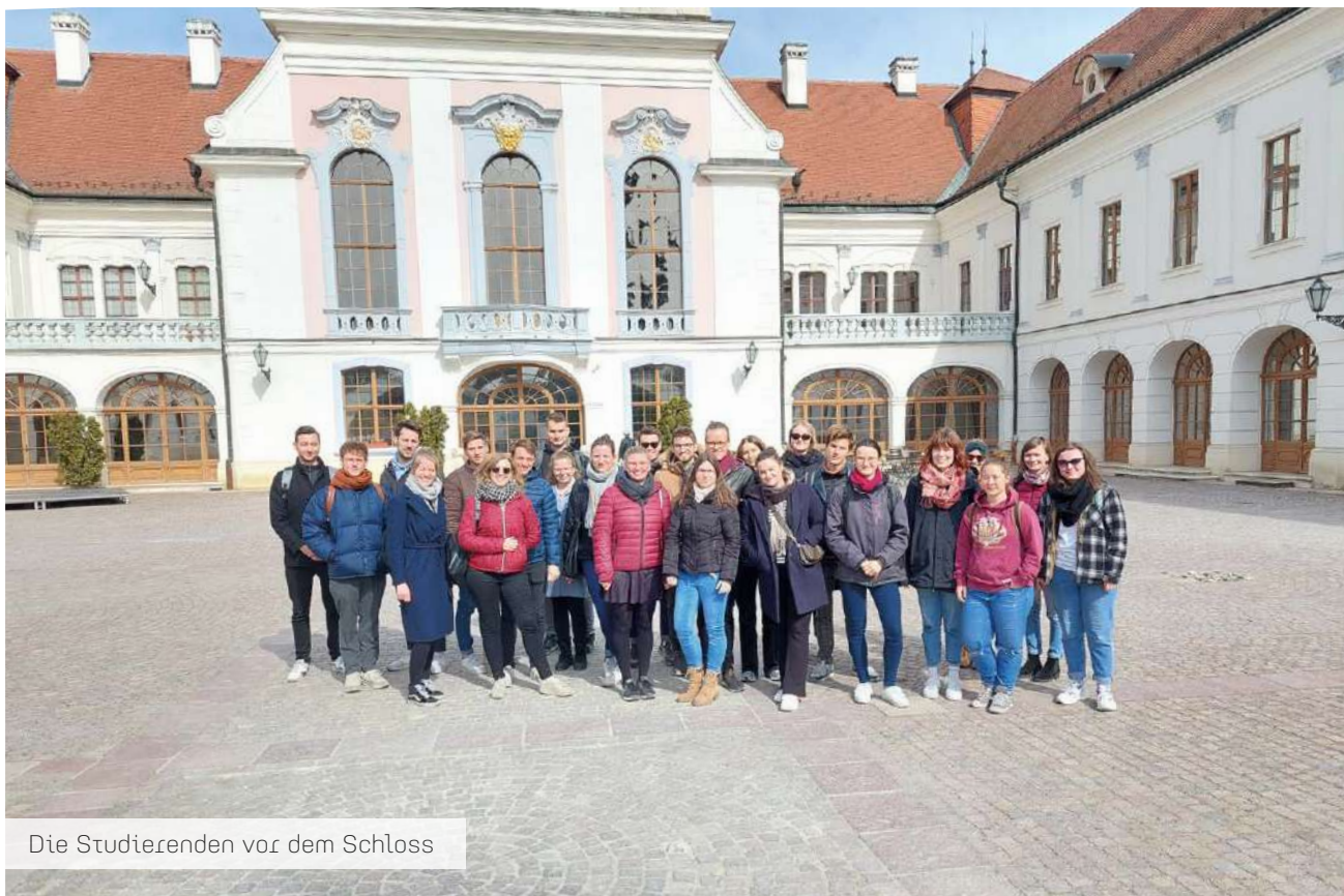
Die Studierenden vor dem Schloss