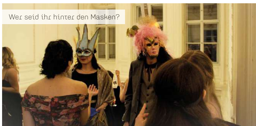
Wer seid ihr hinter den Masken?

A m Samstag, den 23. April 2022, fand nach zwei Jahren Pause der traditionelle Frühlingsball der Studierendenschaft in den Festsälen der Andrássy Universität statt. Rund 160 Gäste – darunter sowohl Studierende als auch Alumni und Externe – kamen zusammen und feierten bis spät in die Nacht hinein. Das diesjährige Motto des Balles lautete „Venezianischer Maskenball“ und so konnten viele tolle, teils aufwändig selbst gestaltete Masken bewundert werden. Die schönste der Masken wurde im Laufe des Abends durch die Gäste gewählt. Ein weiteres Highlight