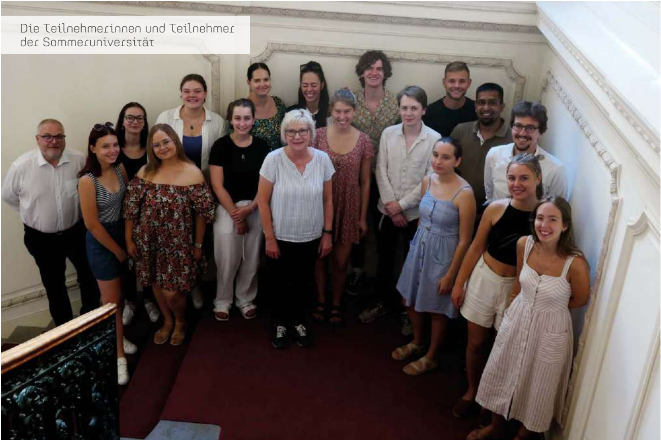
Die Teilnehmerinnen und Teilnehmer der Sommeruniversität

Die Sommeruniversität hatte sich vor diesem Hintergrund das Ziel gesetzt, sich gemeinsam mit folgenden Fragen auseinanderzusetzen: In welcher Beziehung stehen die verschiedenen nationalen Identitäten zu einer Europäischen Identität? Sollten sich die Werte der EU als supranationale Organisation an die Wertvorstellungen der Mitglieder anpassen, und nicht umgekehrt? Was sind die wichtigsten Elemente der gemeinsamen „Kultur der