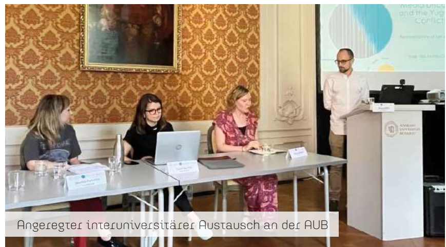
Angelegter interuniversitärer Austausch an der AUB

Deutscher Akademischer Austauschdienst German Academic Exchange Service