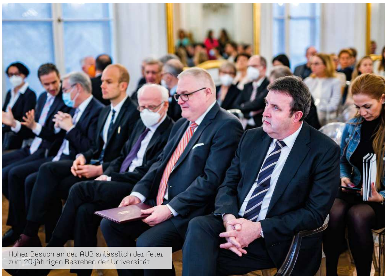
Hoher Besuch an der AUB anlässlich der Feier zum 20-jährigen Bestehen der Universität