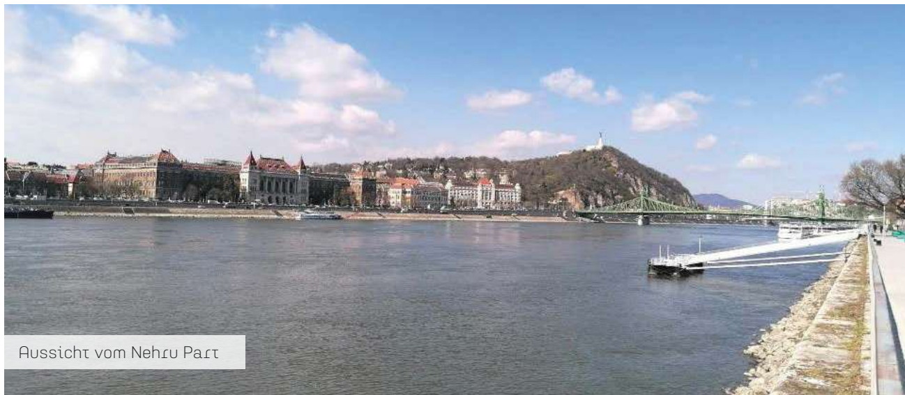
Aussicht vom Nehru Part