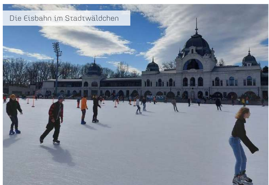
Die Eisbahn im Stadtwaldchen

D ie Studierenden der Andrásy Universität haben im Rahmen des Mentorenprogramms am 25. Februar 2022 die berühmte Schlittschuhbahn neben dem Budapester Stadtpark besucht. Treffpunkt war Punkt 10 Uhr vor dem Eispavillon der Schlittschuhbahn. Da die Veranstaltung für alle Studierenden der Universität offen war, gab es eine gute Mischung von Studierenden aus allen Semestern. Durch die freundliche Unterstützung der Universität durften die Studierenden zu reduzierten Kosten die Schlittschuhbahn genießen.