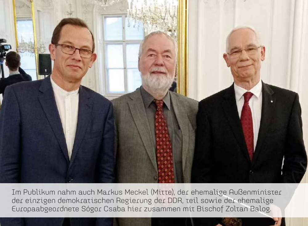
Im Publikum nahm auch Markus Meckel (Mitte), der ehemalige Außenminister der einzigen demokratischen Regierung der DDR, teil sowie der ehemalige Europaabgeordnete Sógor Csaba hier zusammen mit Bischof Zoltan Balog.

Dr. Kreft, stellte nach einer lebhaften Diskussion abschließend fest, dass die Religionsfreiheit ein guter Indikator für den allgemeinen Zustand eines Landes, bzw. einer Gesellschaft sei. Dort wo die Religionsfreiheit unterdrückt werde, sei es auch stets schlecht um andere Freiheiten wie die Meinungs- und Versammlungsfreiheit bestellt. Er dankte der Konrad-Adenauer-Stiftung, die zu einem anschließenden Empfang einlud, für die Unterstützung der Veranstaltung.