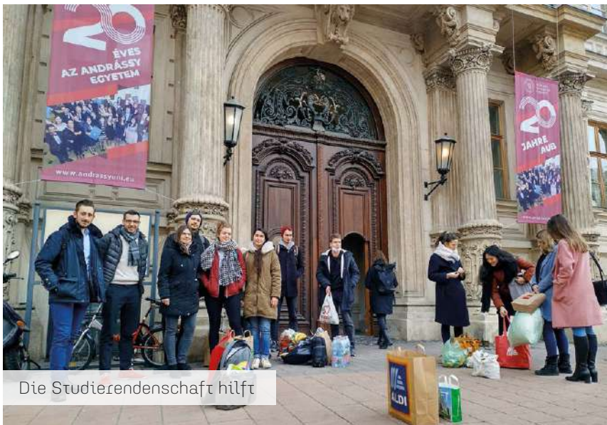
Die Studierendenschaft hilft

Angesichts des Krieges in der Ukraine führte die Studierendenschaft der AUB am 28. Februar 2022 eine Spendenaktion durch.