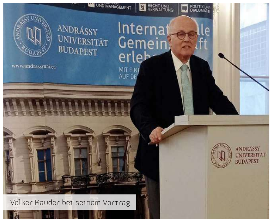
Völker Kauder bei seinem Vortrag

Ungarns engagiere sich aktuell besonders in der Hilfe für Flüchtlinge aus der Ukraine.