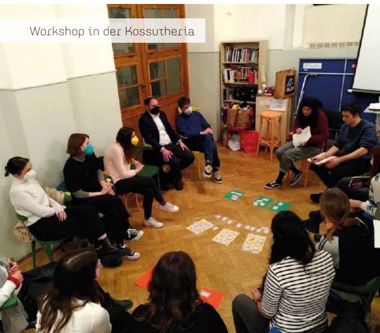
Workshop in der Kossuthercia

Am Dienstag, den 8. März, dem zweiten Tag der Awareness-Tage, fand ein Workshop zum Thema Sexismus und Gewalt gegen Frauen statt. Durchgeführt wurde dieser von Freiwilligen der NGO NANE, die sich gegen Gewalt gegenüber Frauen und Kindern einsetzt. Die Atmosphäre war dabei sehr entspannt und vertraut und lud zum aktiven Mitmachen ein. Zunächst wurden alle Teilnehmenden darum gebeten, zu verschiedenen Statements mit sexistischem Bezug durch entsprechende Positionierung im Raum Stellung zu beziehen. Daraufhin wurde anhand typischer „Red Flags“ erörtert, was „Abusive Relationships“ sind, wie man diese frühzeitig erkennt und wie man Betroffenen helfen kann. Zum Schluss diskutierten die Teilnehmenden über Gleichberechtigung in der Sexualität und den Einfluss