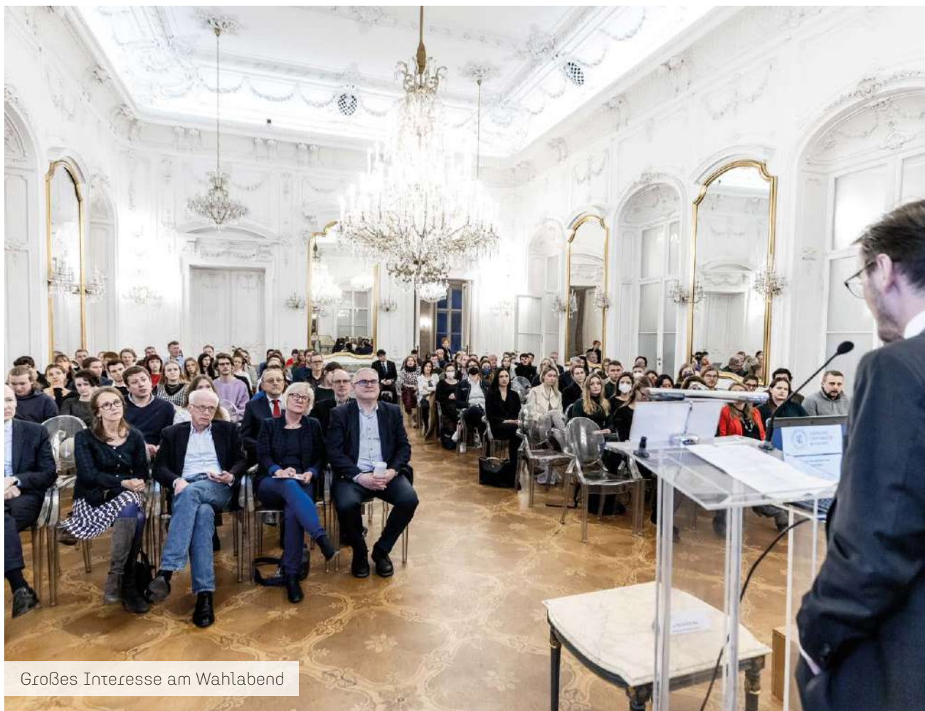
Großes Interesse am Wahlabend