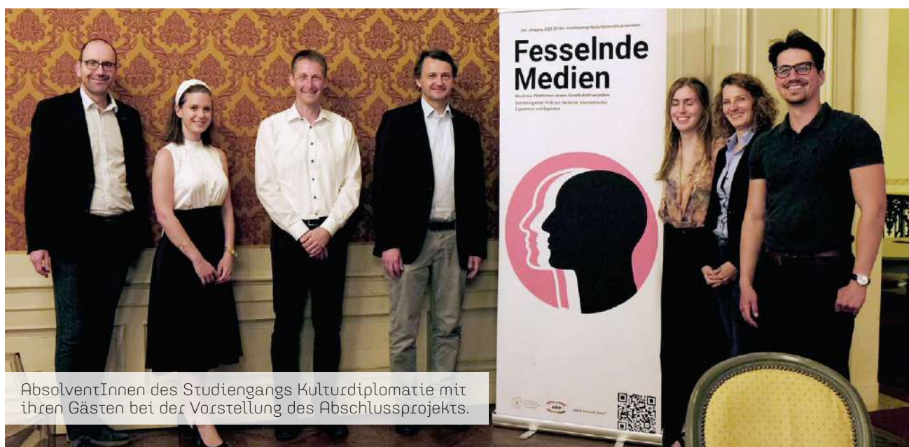
AbsolventInnen des Studiengangs Kulturdiplomatie mit ihren Gästen bei der Vorstellung des Abschlussprojekts.