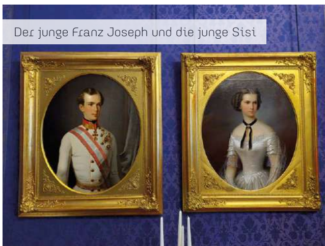
Der junge Franz Joseph und die junge Sisi