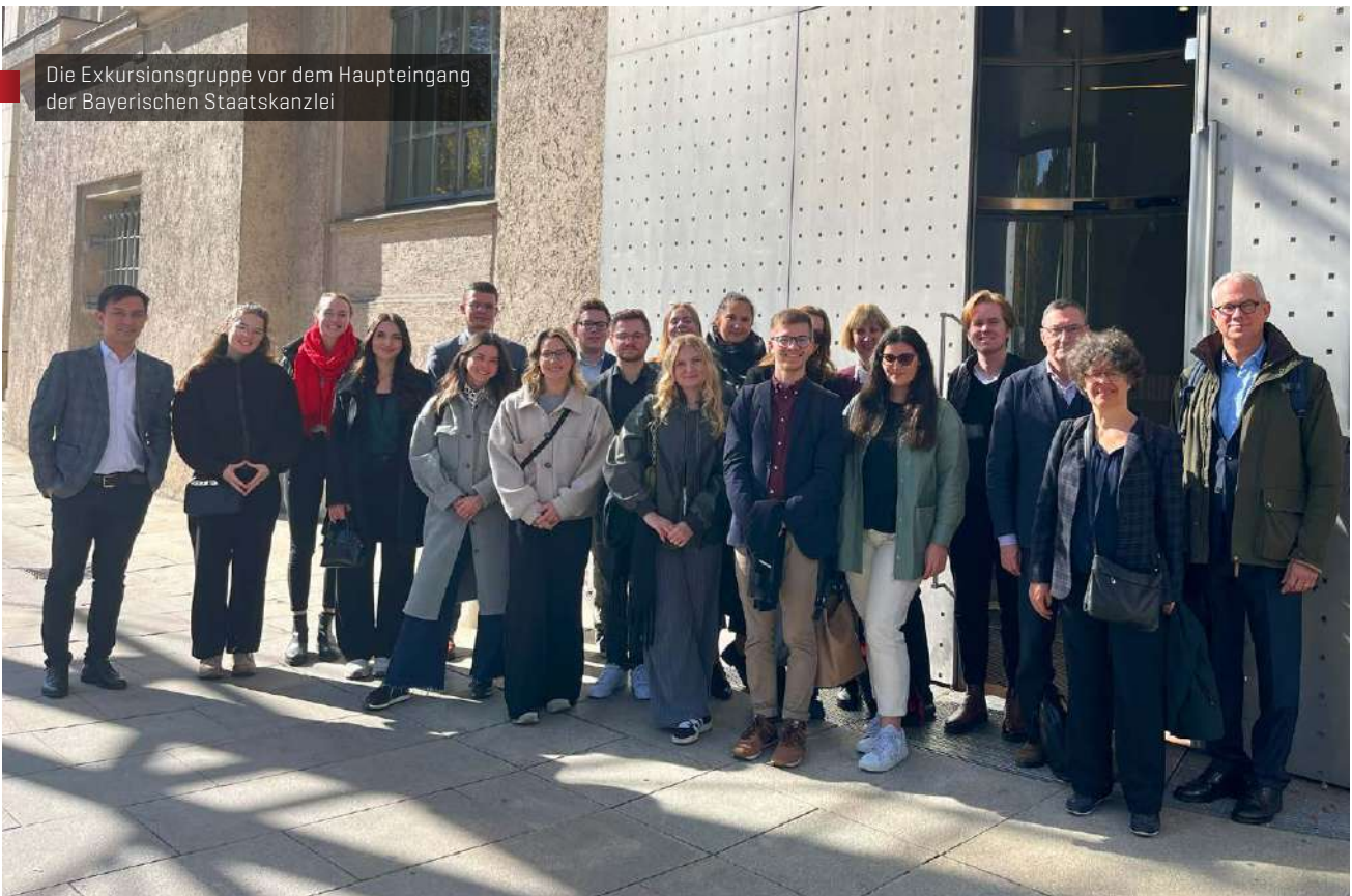
Die Exkursionsgruppe vor dem Haupteingang der Bayerischen Staatskanzlei