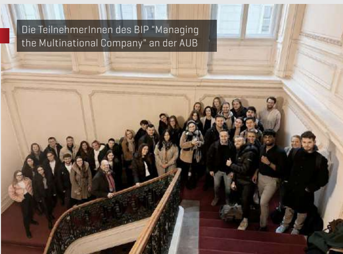
Die TeilnehmerInnen des BIP „Managing the Multinational Company“ an der AUB

Sommersemester 2025