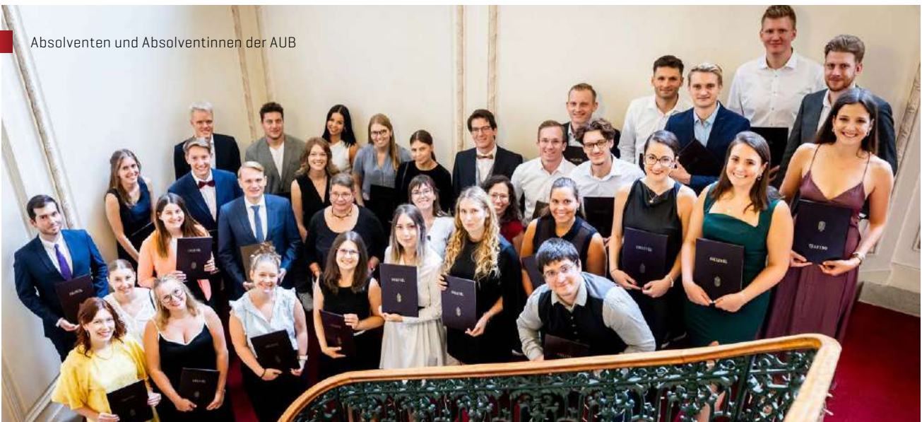
■ Absolventen und Absolventinnen der AUB