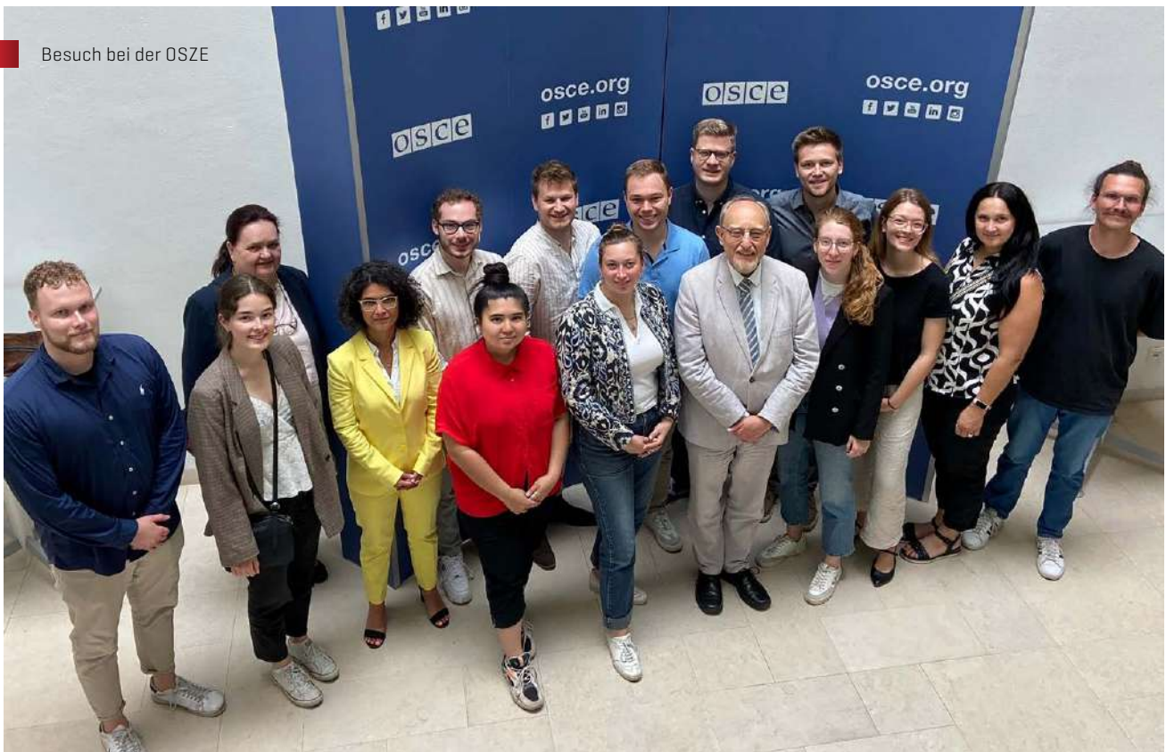
Besuch bei der OSZE

Der nächste Tag bot ein ebenso volles und abwechslungsreiches Programm, beginnend mit einem Besuch der OSZE (Organisation für Sicherheit und Zusammenarbeit in Europa). Leider sei seine Organisation in der Öffentlichkeit nicht sehr bekannt, leiste aber äußerst wichtige diplomatische