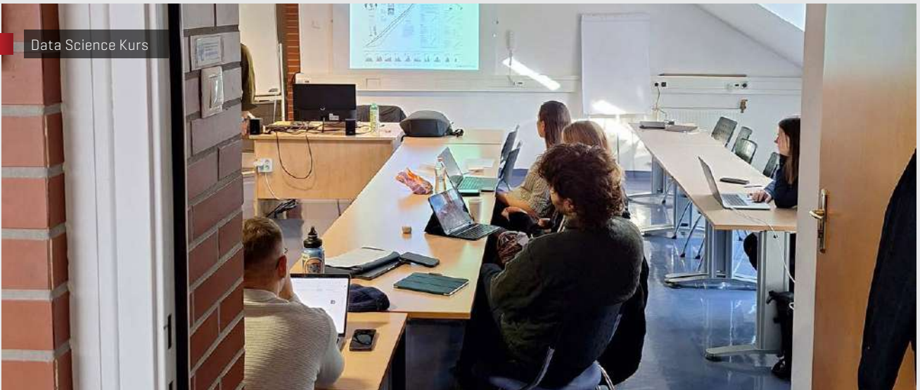
Data Science Kurs