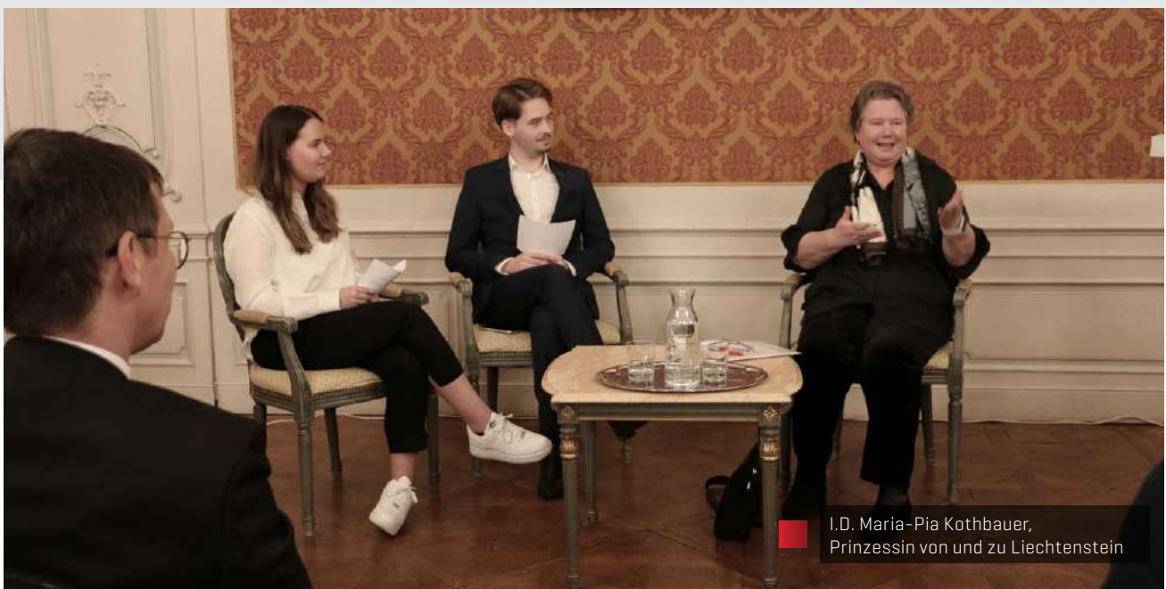
I.D. Maria-Pia Kothbauer, Prinzessin von und zu Liechtenstein

Auch kleine Länder können international großen Einfluss ausüben. I.D. Botschafterin Maria-Pia Kothbauer, Prinzessin von und zu Liechtenstein, berichtete, wie sich das Fürstentum Liechtenstein auf dem internationalen Parkett behauptet.